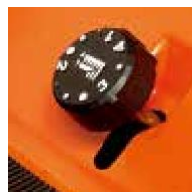
Централно регулиране на височината на косене, което може да се управлява от шофьорското място