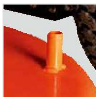
Връзка за почистване на косачия механизъм