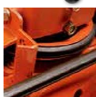
Издръжлив и особено стабилен шестоъгълен ремък (Задвижването на ремъка е покрито.)